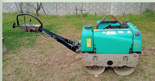
ハンドローラー (0.8t級) 車道部・歩道部対応