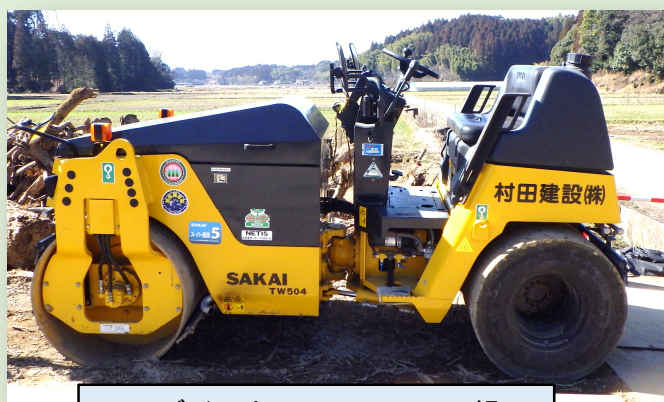
コンバインドローラー (6t級) 車道部・歩道部対応