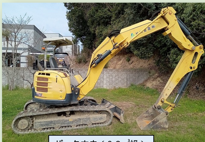
バックホウ (0.2m 3 級) 車道部・歩道部対応