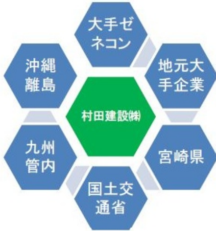
トンネル部門（下請け業務）