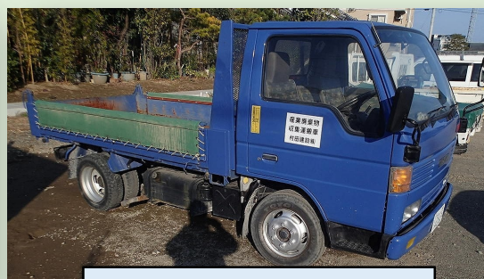
ダンプトラック (2t級) 歩道部対応 (合材運搬)