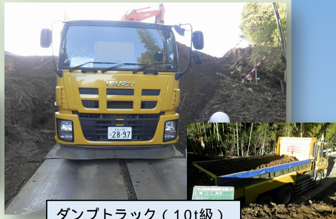
ダンプトラック (10t級) 車道部対応 (合材運搬)