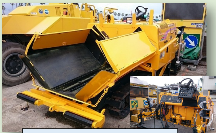
アスファルトフィニシャ (6m級) 車道部・歩道部対応