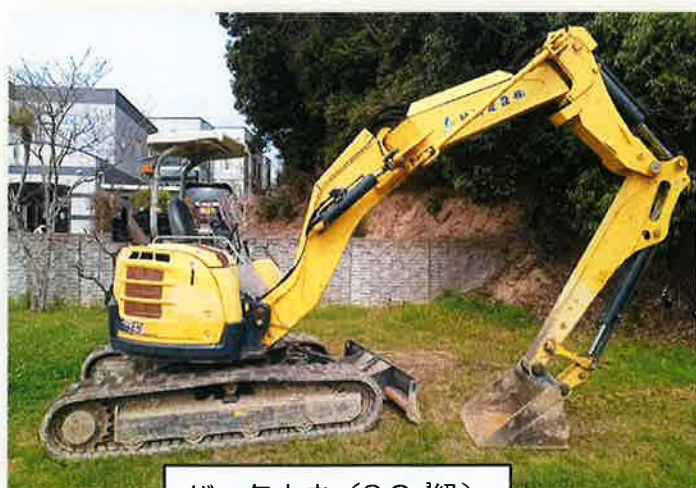
バックホウ (0.2m級) ※車道部・歩道部対応