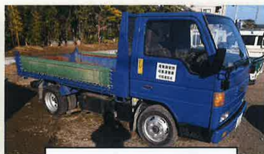
ダンプトラック (2t級) ※歩道部対応 (合材運搬)