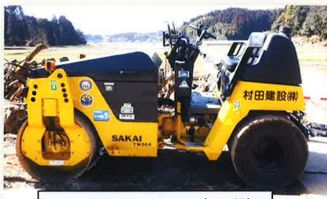
コンパインドローラー (6t級) ※車道部・歩道部対応