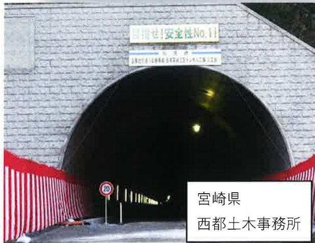
宮崎県 西都土木事務所