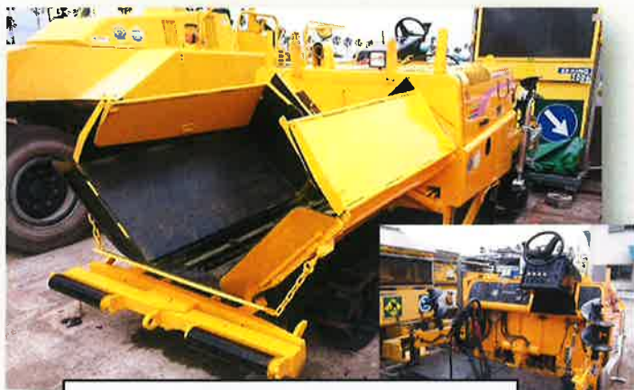
アスファルトフィニシャ (6m級) ※車道部・歩道部対応