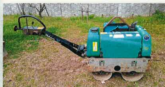
ハンドローラー (0.8t級) ※車道部・歩道部対応