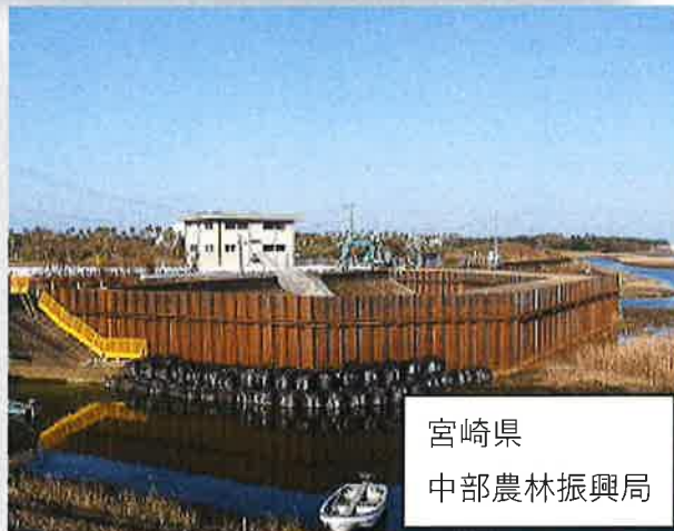
宮崎県 中部農林振興局