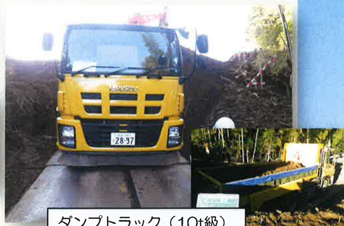
ダンプトラック (10t級) ※車道部対応 (合材運搬)